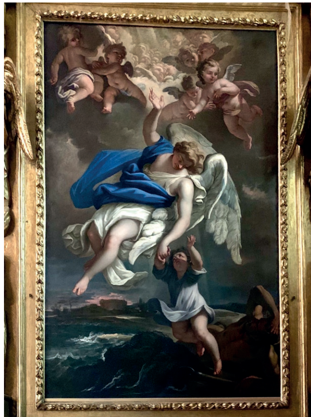
Fig. 4. Sebastiano Ricci, L'Angelo Custode , c. 1694, Pavia, Chiesa di Santa Maria del Carmine.

nismo del marchese) risultano coerenti anche con il soggetto del capolavoro di Ricci a Pavia: la pala raffigurante l'Angelo Custode nella chiesa di Santa Maria del Carmine, alla cui genesi forse il marchese non fu estraneo, per lo meno come intermediario cointeressato.