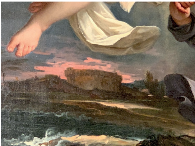
Fig. 7. Sebastiano Ricci, L'Angelo Custode , c. 1694, Pavia, Chiesa di Santa Maria del Carmine (particolare).