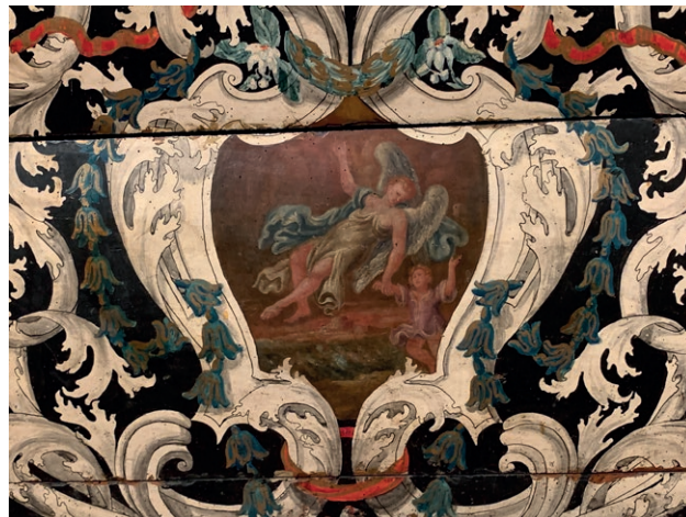
Fig. 8. Paliotto d'altare, L'Angelo Custode , sec. XVIII, Pavia, Chiesa di Santa Maria del Carmine.