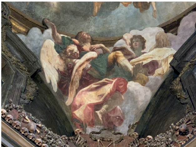
Fig. 9. Sebastiano Ricci, Apoteosi di un Santo , 1694-1695, Milano, Ossario della chiesa di San Bernardino.

lo il cui battito d'ali soffici di piume bianche è esibito con virtuosismo, come a Pavia 37 .