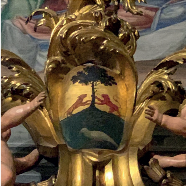
Fig. 5. Stemma della famiglia Bonatti, cimasa della cornice della pala dell'Angelo Custode.

La sua picaresca figura è stata ripescata da Giovanni Godi e Giuseppe Cirillo nelle pagine del cronachista francese Casimir Freschot del 1711, che dicono davvero tutto 26 .