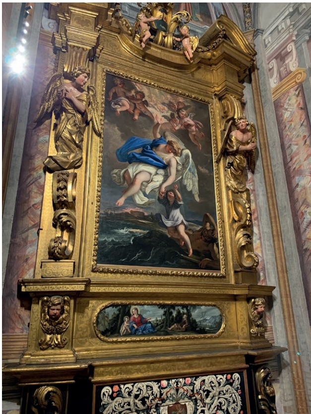
Fig. 3. Sebastiano Ricci e intagliatori lombardi, pala dell'Angelo Custode , c. 1694, Pavia, Chiesa di Santa Maria del Carmine.