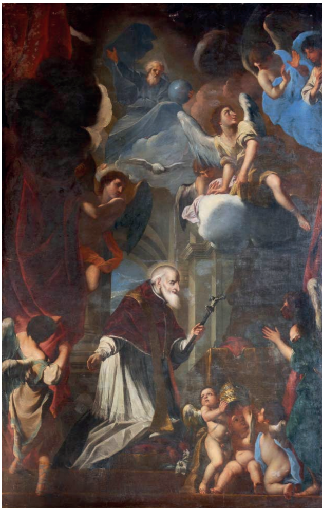
Fig. 2. L. Scaramuccia, Pio V e il miracolo del Crocifisso. Pavia, Collegio Ghislieri.