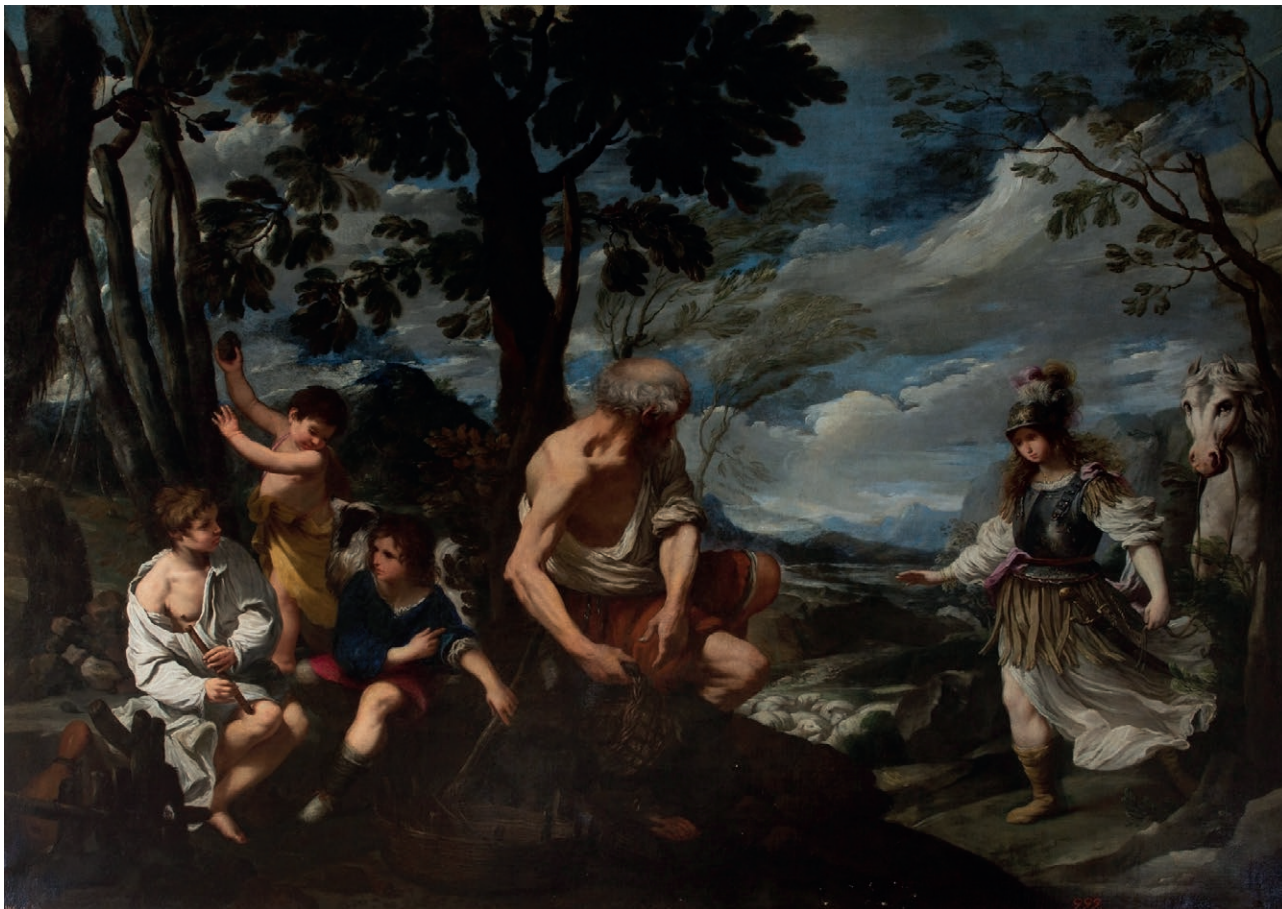
Fig. 1. L. Scaramuccia, Erminia e i pastori . Barcellona, Università (deposito del Museo del Prado).

tela che solo in anni recenti, dopo una consolidata assegnazione a Solimena, è stata restituita a Scaramuccia, il quale la realizzò per il marchese genovese Giovanni Francesco Serra di Cassano, generale e alto dignitario al servizio della corona spagnola, entro il 1652, quando il nobile lasciò Milano per la Spagna, chiamato da Filippo IV 30 . Nella collezione Serra, lo sappiamo, erano presenti dipinti estremamente importanti, che certamente furono meditati da Scaramuccia e gli furono utili sia per la sua attività pittorica sia per quella di scrittore d'arte 31 . Tra le altre opere era compresa anche la Venere, Adone e cupido di Annibale Carracci (ora al Museo del Prado), la quale fu copiata dall'autore de Le finezze e incisa ad acquaforte nel 1655, con la dedica a Niccolò Simonelli 32 .