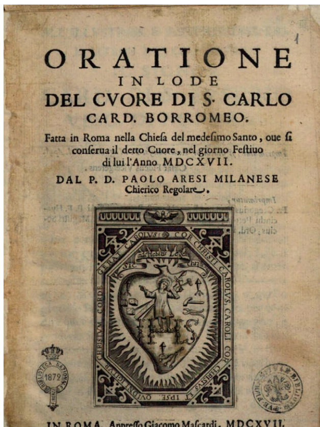
Fig. 1. Paolo Aresi, Oratione in lode del cuore di s. Carlo Card. Borromeo , in Roma, appresso Giacomo Mascardi, MDCXVII, frontespizio.

padre Cesare Bonino, Nonnulla praeclara gesta del 1610, con la realizzazione della serie di 53 tavole incise della vita del beato Carlo 12 . L'iconografia del volume di Bonino illustrato da Ronco (una figurazione con al centro il santo in adorazione circondato da venti riquadri con gli episodi della sua vita), a sua volta basata sulla rielaborazione dei cicli pittorici promossi dal cardinale Federico Borromeo che si andavano elaborando nei primi anni del Seicento nel Salone d'Onore del collegio Borromeo di Pavia per mano di Cesare Nebbia e Federico Zuccari 13 , nella cappella del santo nel Palazzo dell'Arcivescovado a Milano 14 e, soprattutto, nell'apparato effimero costituito dai venti teleri esposti in Duomo nella ricorrenza del 4