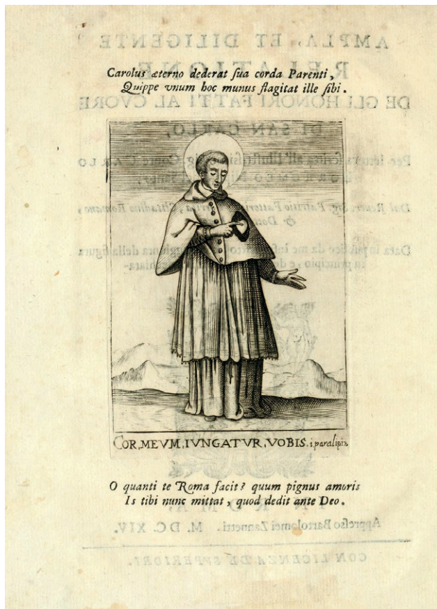
Fig. 2. Patrizio Fattorio di Torrita, Ampla et diligente relatione de gli onori fatti al cuore di San Carlo , in Roma, appresso Bartolomeo Zannetti, 1614, tavola 1.