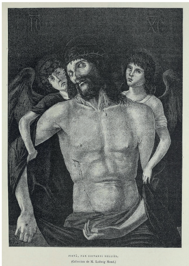
Fig. 3. Giovanni Bellini, Cristo morto sorretto da angeli , incisione (da G. Gronau, Correspondance d'Angleterre , cit. [vedi nota 34], tavola n. 32).

sottolineatura del sentimento religioso insito nell'opera del pittore veneziano, che trovava l'espressione più alta proprio nella raffigurazione del tema della Pietà, più volte frequentato da Bellini 39 . Fry tentò di seriare le versioni sin lì note di questo soggetto: pur citandolo in modo fugace, l'esemplare di Londra veniva collocato a mezza via tra quello di Brera, contraddistinto da una «summary simplification of the planes of the figure» 40 , e di Rimini, che invece rappresentava «the apogée of Bellini's feeling for structural design». Con la tavola di Berlino, considerata l'ultima della serie, Fry notava che la carica drammatica degli anni giovanili si stemperava invece nella «beautiful flaccidity of the dead figure». Qualche anno più tardi, in The study and criticism of Italian art ,