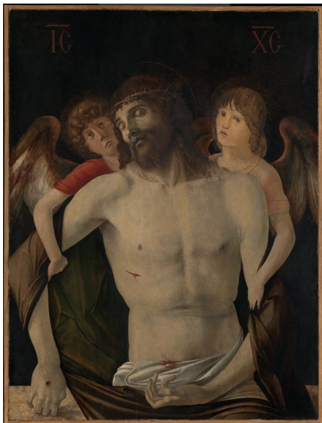
Fig. 1. Giovanni Bellini, Cristo morto sorretto da angeli , olio su tavola, 94,6 x 71,8 cm. Londra, National Gallery, inv. NG3912. (Mond Bequest, 1924, © The National Gallery, London).

dra, all'epoca custodito nella residenza di Cesare Menghini al civico 754 di contrada San Francesco a Mantova (odierna via Giovanni Marangoni) 7 . Come si evince dall'appunto riportato sopra, nel 1874 Morelli e Frizzoni corressero il precedente riferimento a Mantegna, evocando a confronto altri celebri esemplari belliniani del Museo Correr, della Pinacoteca di Brera, della Gemäldegalerie di Berlino, del Museo Civico di Rimini, proponendo al tempo stesso una datazione attorno al 1480. Una scoperta, quest'ultima, che dovette entusiasmare il senatore al punto da darne notizia, in presa diretta, all'amico e collezionista Henry Austen Layard in una lettera del 12 novembre 1874, dove comunicava di aver termi-