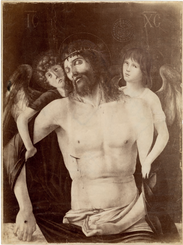
Fig. 2. Giovanni Bellini, Cristo morto sorretto da angeli , fotografia Henry Dixon, 1889 (?). ABABrera, Fototeca Frizzoni, inv. 5128. (@ Accademia di Belle Arti di Brera, Milano).

Venetian Art' organizzata nell'inverno 1894-1895 presso la New Gallery a Regent Street 31 . Nel contestare gran parte delle attribuzioni in favore di Bellini proposte nel catalogo che accompagnava quella manifestazione, Bernard Berenson, in un celebre saggio del 1895, non mancò invece di riconoscere nel dipinto in esame «the noblest of all Bellini's versions of this subject, with the exception, possibly, of the kindred picture at Berlin» 32 . Un parere assai positivo, dunque, ancor più se si tiene conto degli evidenti problemi conservativi della tavola,