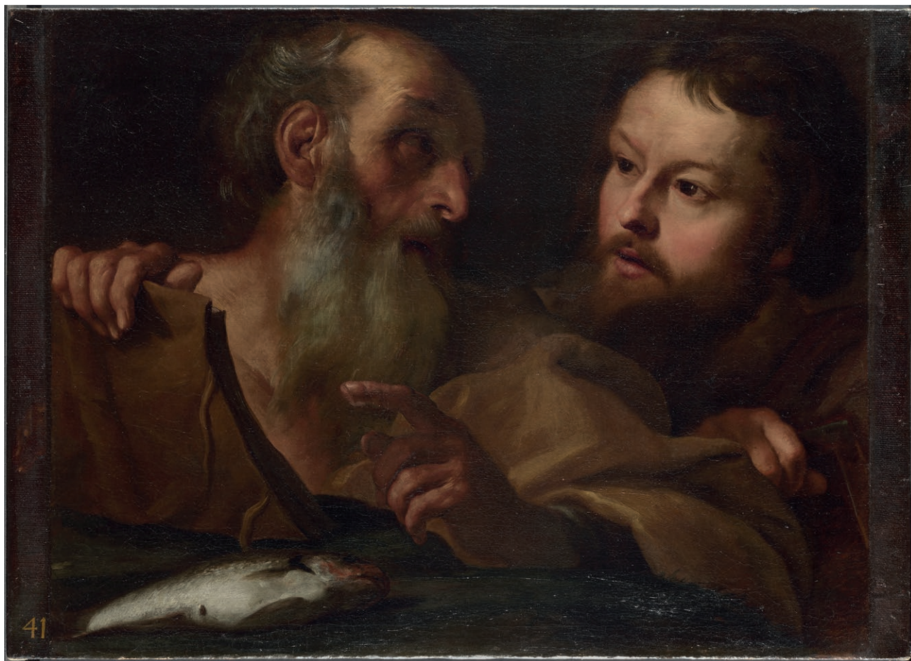
Fig. 14. Gian Lorenzo Bernini, Sant'Andrea e San Tommaso , © The National Gallery, London. © The National Gallery N 6381.

Le altre opere menzionate non hanno sufficienti elementi per un riconoscimento certo.