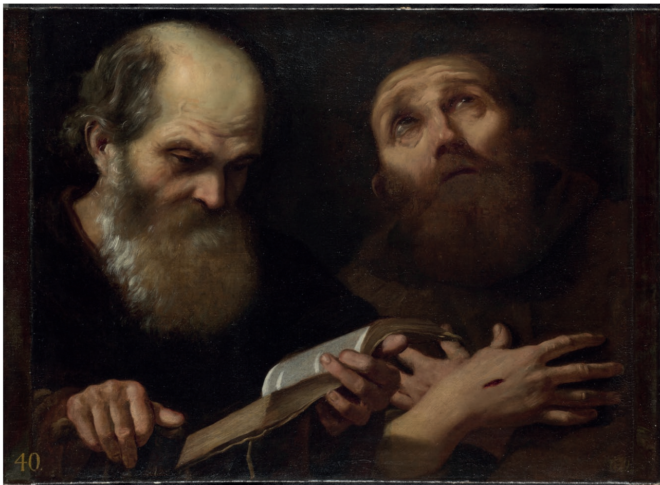
Fig. 13. Andrea Sacchi, Sant'Antonio abate e San Francesco d'Assisi , © The National Gallery, London N 6382.

questa ipotesi è il ritrovamento di una inedita versione della probabile seconda parte dell'inventario dei quadri post mortem di Filippo III Colonna del 1818 dove è citato: «Uno di dieci [palmi] per traverso, Lot, e le figlie, autore incerto» con una postilla a latere di altra grafia indicante il numero «698», 74 lo stesso numero che com-