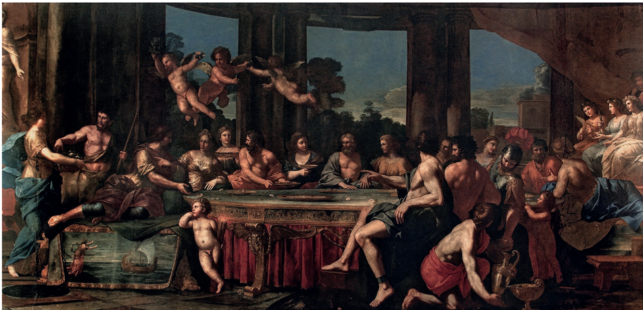
Fig. 7. Giovan Francesco Romanelli, Le Nozze di Peleo e Teti , Roma, Collezione I.N.P.S.

ca tra il 1952 e il 1972, 53 un San Gerolamo allora attribuito a Salvator Rosa, oggi a Giovanni Battista Pace, che si trova nella Faringdon Collection di Buscot Park, Oxfordshire, 54 la Lotta di Giacobbe e l'Angelo di Cristoforo Roncalli, conservato nel Minneapolis Institute of Art 55 e, inoltre, uno «Studio di teste», che è da identificare con uno dei due quadri con «Due teste» che compaiono nell'inventario Barberini del 1844 con una attribuzione ad Andrea Sacchi; 56 il dipinto corrisponde ai Sant'Antonio abate e San Francesco d'Assisi (fig. 13) pendant dei Sant'Andrea e San Tommaso (fig. 14), definito quest'ultimo nell'inventario senza stime del 1812 erroneamente «Girolamo» 57 e già assegnato ai Barberini; nonostante il basso valore attribuito loro dai periti (uno scudo) e dichiarati anonimi, sappia-