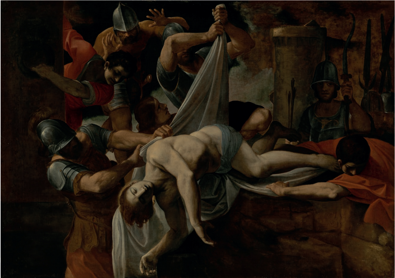
Fig. 12. Ludovico Carracci, San Sebastiano gettato nella Cloaca Massima , Los Angeles, Getty Museum.

Dunque il numero 215 dipinto in basso a destra sul quadro di Lot e le figlie non può essere del XVIII secolo, ma più tardo 71 . Il simbolo della colonna con corona dipinto sulla tela e la presenza nell'inventario Barberini del 1844 di un quadro di autore anonimo di analogo soggetto e con misure compatibili proveniente dalla eredità Colonna, 72 orienterebbero ad escludere l'identificazione proposta. La tela deve essere entrata in casa Barberini a seguito della divisione ereditaria del patrimonio Colonna dopo la morte di Filippo III (†1818) tra le sue tre figlie e il nipote Aspreno Doria Colonna; 73 a conforto di