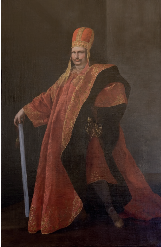
Fig. 8. Andrea Sacchi, Ritratto del Principe Prefetto Taddeo Barberini, Roma, Collezione I.N.P.S.

sano, un Ritratto del cardinale Antonio Barberini junior , probabilmente di piccolo formato dato lo scarso valore assegnato, forse identificabile con quello oggi nelle Gallerie Nazionali di Arte Antica di palazzo Barberini acquistato nel 2021 e attribuito a Simone Cantarini 63 . Maffeo senior cedette infine un «Santo che converte il carceriere», allora dato a Domenico Cresti detto il Pas-