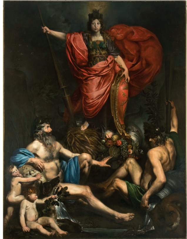
Fig. 9. Valentin de Boulogne, Allegoria dell'Italia, Roma, Institutum Romanum Finlandiae.