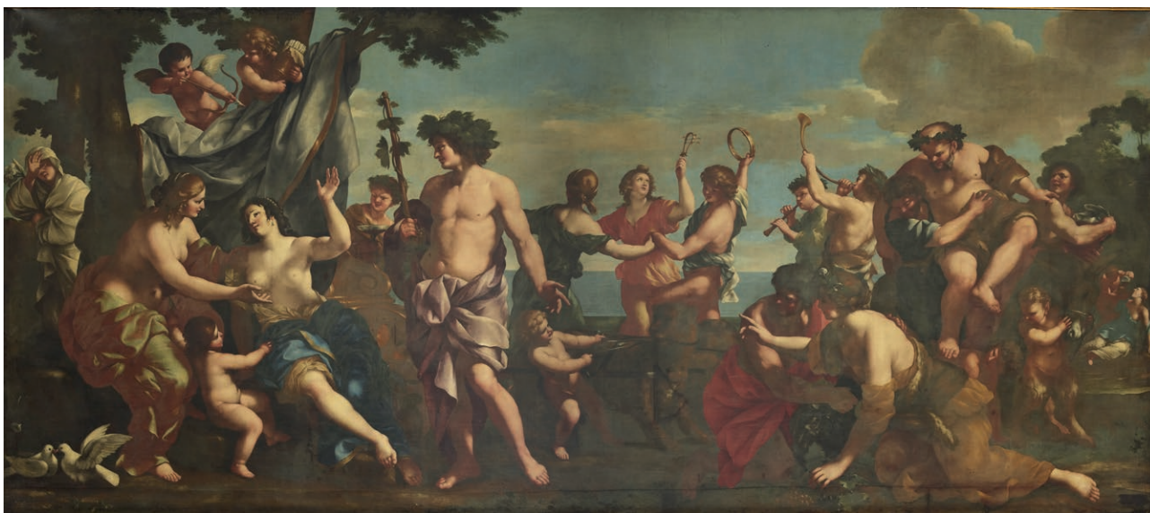
Fig. 11. Giuseppe Belloni, Bacco e Arianna , Roma, Gallerie Nazionali d'Arte Antica, palazzo Barberini.

più approfonditamente in altra sede. Si può anticipare intanto che è più che improbabile che a un quadro Barberini della prima metà del XVII secolo, nel Settecento, per effetto di un matrimonio con un membro della famiglia Colonna sia stato aggiunto un simbolo Colonna;