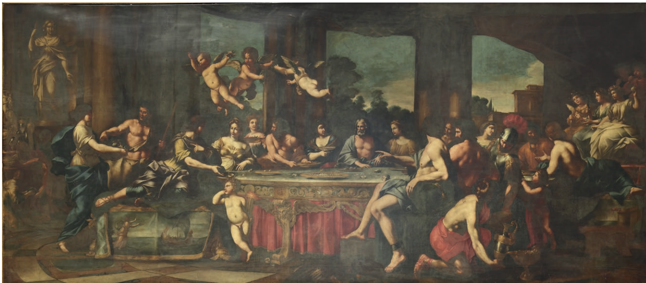
Fig. 10. Giuseppe Belloni, Le Nozze di Peleo e Teti , Roma, Gallerie Nazionali d'Arte Antica, palazzo Barberini.