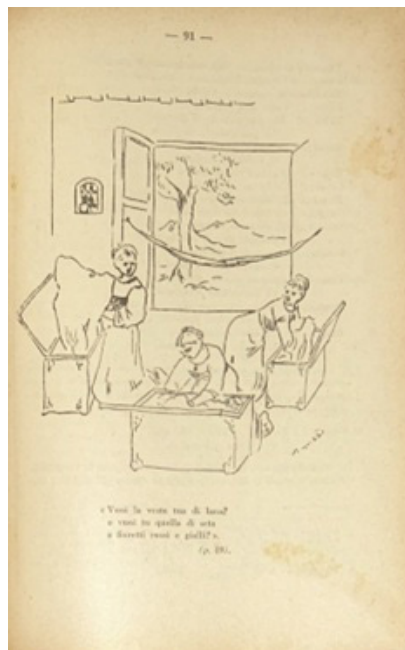
Figura 2: Illustrazione di Virgilio Guzzi (p.91) a corredo del brano Rito Nuziale di Gabriele D'Annunzio

La mia scarsa simpatia per La figlia di Iorio [...] si accentuò, in quella medesima stagione, sfogliando un'antologia per le scuole medie, Casa giocosa , compilata, oltre che da mio padre, da un celebre pedagogista (Ernesto Codignola) e da un letterato militante nonché studioso dell'autore delle Laudi (Eurialo De Michelis). Era tramontata l'epoca trionfale del d'Annunzio, eppure in quell'antologia nessuno era rappresentato con l'abbondanza concessa a lui. Illustrato da un disegno del pittore Guzzi, vi si riportava l'inizio della prima scena, appunto, de La figlia di Iorio , dove tre giovinette dai nomi improbabili si parlano in un altrettanto improbabile italiano 35