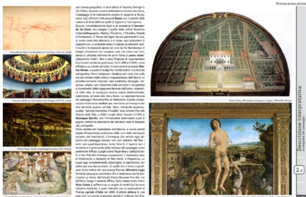
Figura 2. Un estratto dell'elaborato "Iconografia del paesaggio" della scheda d'ambito 06 - Firenze Prato Pistoia.