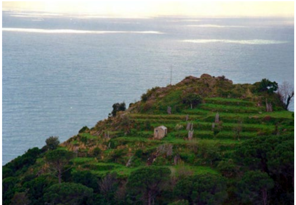
Fig. 2. Esempio di "terreni soggetti a coltura" nell'alto versante della Valle Vescini.

Seguono, infine, le strategie; sintetizzate come "paesaggio economico moderno", "paesaggio arcadico", "paesaggio naturale", "paesaggio di ripristino rurale". Ne viene descritto il fondamento logico (cioè la fattibilità in senso economico, sociale e culturale) e valutato l'impatto sulle funzioni del paesaggio precedentemente individuate. Gli scenari di ogni strategia, condizionati dalla distribuzione, dal contenuto e dalle dinamiche degli ecotopi, sono valutati mediante sei indicatori strategici di sintesi: "sostenibilità", "economia", "biodiversità", "sviluppo rurale", "turismo", "coerenza paesaggistica".