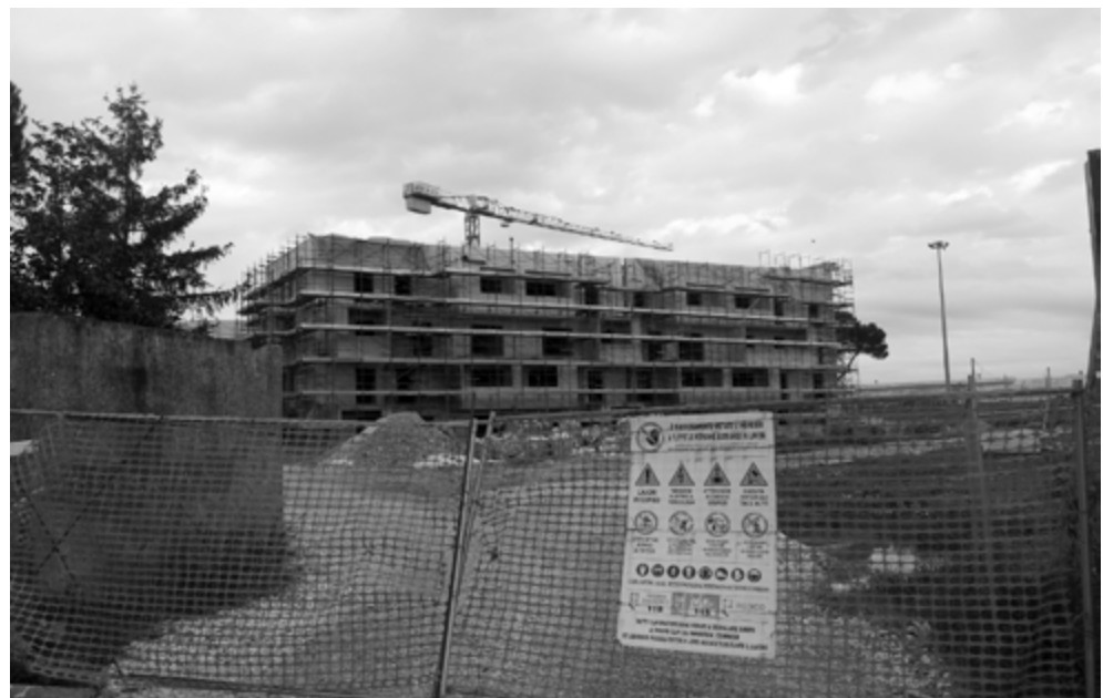
Fig. 3. Gli edifici 'volano' in costruzione.

La prima operazione effettuata, al fine di valutare la realizzabilità dell'idea di procedere secondo l' iter della demolizione con ricostruzione, è stata un'indagine sociologica. Affidata al Dipartimento di ingegneria civile dell'Università di Pisa, essa ha rivelato come la domanda prevalentemente espressa dagli abitanti fosse quella di rimanere nel quartiere, unita a quella di non spostarsi dalla zona durante il periodo di ricostruzione per poi tornarvi successivamente, visto che per la maggior parte di essi affrontare due traslochi consecutivi sarebbe stato un impegno troppo gravoso, data la fascia d'età medio-alta, nonché il reddito ridotto. Per venire incontro a tali esigenze è nata l'idea di gestire l'operazione attraverso un progressivo programma di costruzione, riallocazione degli abitanti e demolizione dei vecchi edifici, sì da ridurre al minimo i loro spostamenti e da concludere l'intera operazione in un periodo di 8 anni.