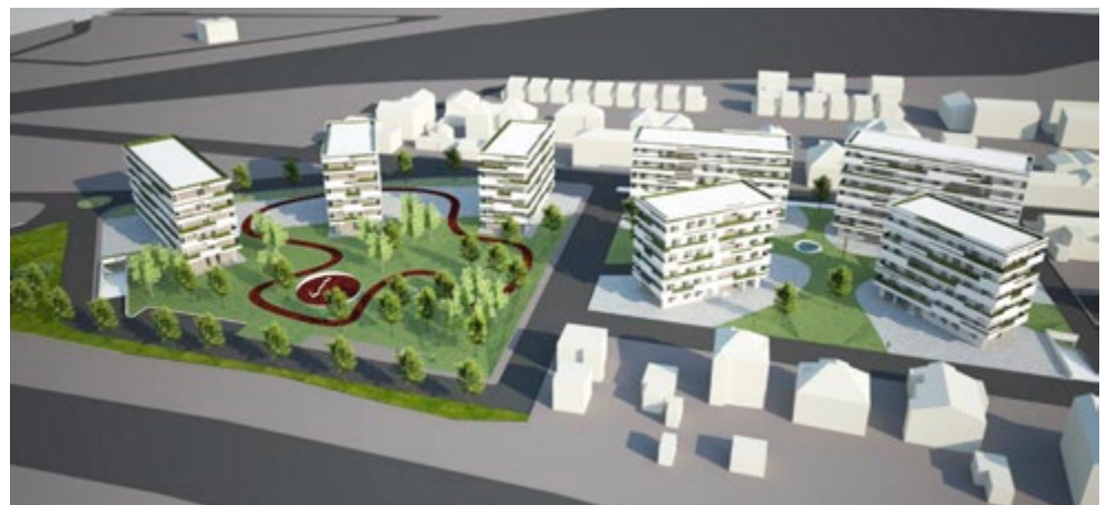
Fig. 5. Masterplan "Per un quartiere sostenibile": vista.

L'intera operazione urbanistico-architettonica ha come obiettivo prioritario la creazione di un quartiere a zero consumo di energia, perseguita da un lato con un impianto urbano caratterizzato da un'ampia presenza di verde, dall'altro con l'impiego di criteri progettuali atti alla costruzione di edifici a consumo zero, grazie a specifiche scelte relative a involucri e impianti.