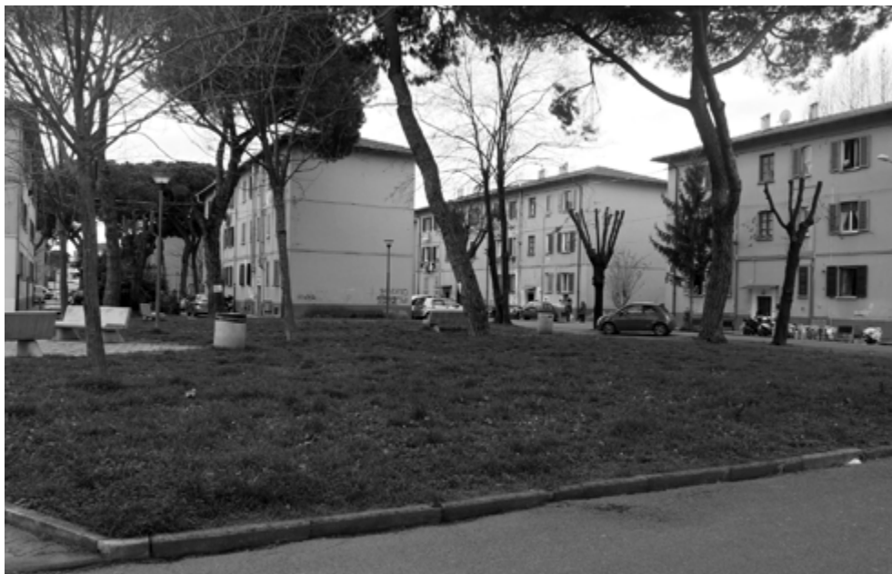
Fig. 1. Lo spazio pubblico nell'area in trasformazione.

È costituita da due isolati di edilizia residenziale a carattere popolare costruiti alla fine degli anni Quaranta, organizzati secondo una maglia distributiva geometrica ed estensiva, perfettamente orientata dalla cultura urbanistica del periodo, nella quale lo spazio pubblico assume la forma di due giardini rettangolari posti tra le residenze, l'uno dedicato ai giochi dei bambini, l'altro destinato a piccolo parco urbano.