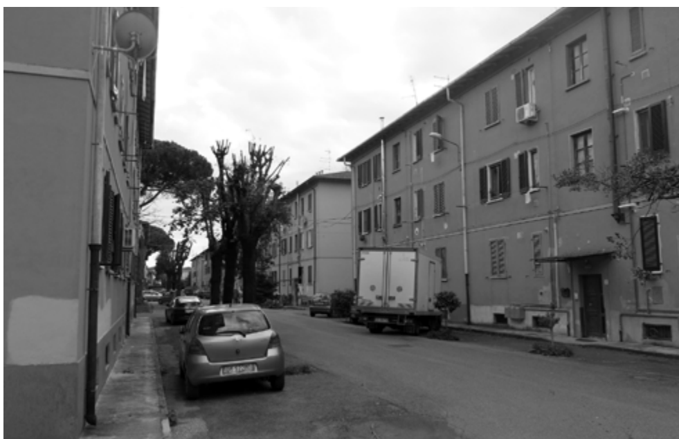
Fig. 2. Gli edifici da demolire.

Gli edifici, dalla tipologia 'in linea' a 3 piani, sono 18, per un totale di 216 appartamenti. Quest'ultimi, di proprietà del Comune, vengono gestiti da APES - Azienda pisana di edilizia sociale - che li attribuisce, secondo le consuete modalità di allocazione previste dalle tradizionali politiche di housing sociale, ai cittadini aventi diritto. L'area, nel tempo, si è fatta carico di diverse realtà di marginalità, che le hanno in parte attribuito la configurazione di un' enclave sociale. A ciò si somma, in un connubio forzato tra marginalità fisica e sociale, un avanzato degrado fisico degli edifici, stante anche la pessima qualità della progettazione e dei materiali con i quali erano stati eseguiti.