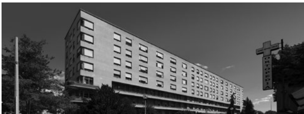
Fig. 3. Il Monoblocco lungo via Caraccio (Giugno 2013).