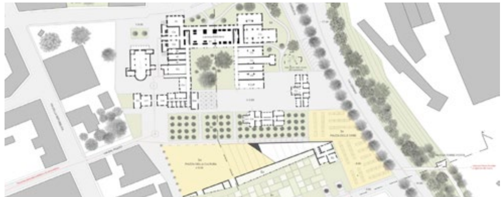
Fig. 4. Planimetria 1:500 (Settembre 2013).

Dell'abbattimento del Monoblocco rimarrà qualche frammento , che farà parte del nuovo progetto (PIVA 2007), che conterrà l'innovativo e privato Museo del tessile, con stanze per aziende 'illustri' e 'minori', con spazi didattici e di ricerca 'estrema', rivolta al futuro e nel contempo al passato, con belvedere sulla pianura e nuovo ristorante-bar che prepara cibi locali, "buoni e giusti" (PETRINI 2005), con ingredienti del "nuovo monastero laico". Rimarrà così un 'vuoto' che diventerà cerniera tra centro storico e territorio, tra Biella-Piano e la campagna del torrente Cervo. Dalle macerie del Monoblocco sorgerà una rinnovata maniera di abitare la terra e di ridefinire formalmente, socialmente, funzionalmente ed economicamente un lembo di città.