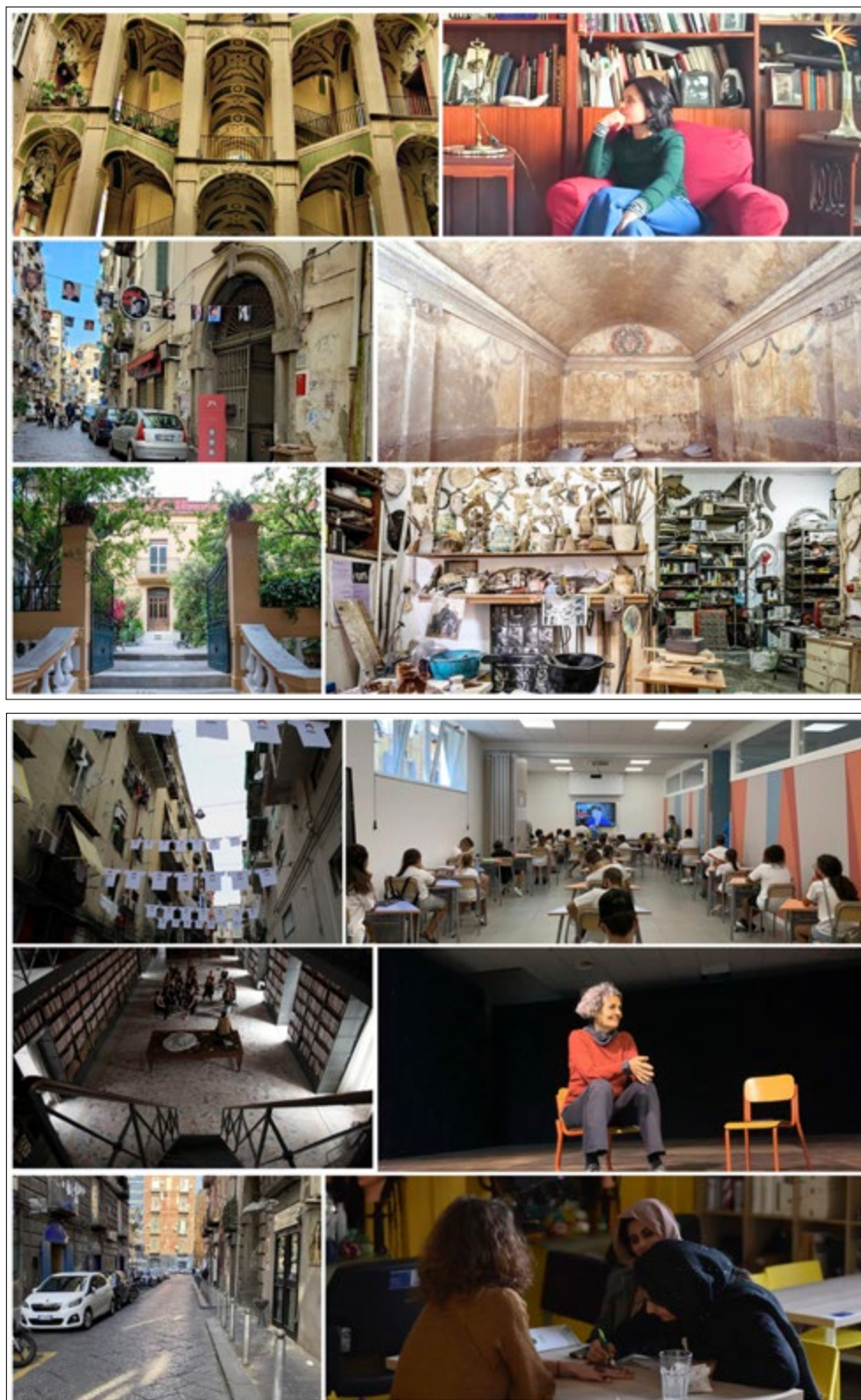
In alto: Figura 2. Le pratiche narrate nel Rione Vergini-Sanità (nell'ordine: Brodo ; Ipogeo dei Cristallini ; Laboratorio Oste ); qui accanto: Figura 3. Le pratiche narrate nel Rione Forcella (nell'ordine: La Casa di Vetro ; f.pl. femminile plurale ; La Radice di Coira ).

dell'associazione Celanapoli che opera nel rione Sanità per il recupero e la fruizione degli spazi ipogei. L'analisi di questa pratica, pur di limitata dimensione e raggio d'azione, contribuisce all'identificazione della rete che si sta sviluppando tra iniziative di diversa natura collegate alla creatività e alla fruizione del patrimonio culturale.