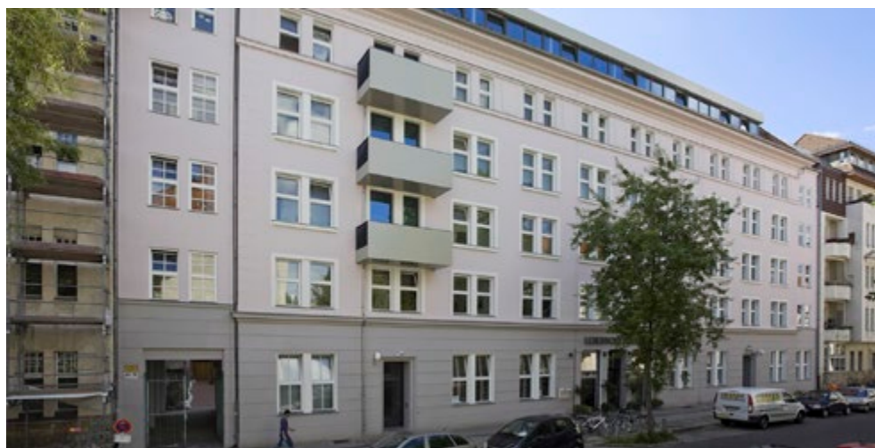
Figura 4. Co-housing LGBTI Lebensort Vielfalt dello Schwulenberatung, Charlottenburg Berlin.