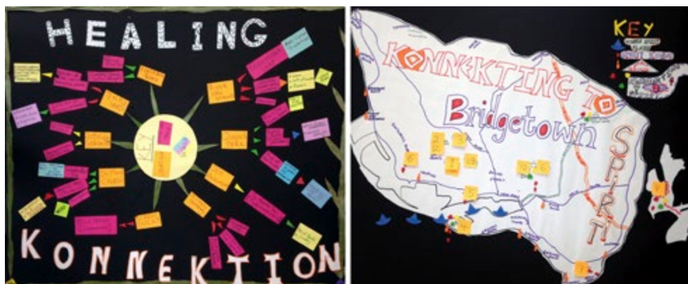
Figure 1. Conceptual maps elaborated by Students of the “My Barbados. The Soul of Barbados” lab.

The Students had the opportunity to systematize and represent by accessible mapping techniques their newly acquired knowledge and awareness, contributing to the knowledge, enhancement and protection of the traditional urban and rural landscape and thus finding in the lab a structured emancipation path.