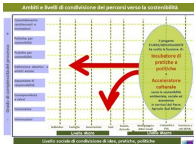
Tabella 1. Ricerche di "SELS", da < http://www.economiasolidale.net/content/disponibili-materiali-del-progetto-sels > (07/2019).

In precedenti progetti, come il già citato "GenuinaGente / Filiere agroalimentari sostenibili e comunità locali", sono state definite alcune prime 'bussole' e strumenti (gli 'incubatori/acceleratori culturali') che possono permettere ai diversi soggetti territoriali, dal livello micro (singoli cittadini, famiglie aggregate o meno nei GAS) al livello macro (reti di attori, imprese e Amministrazioni locali), di affrontare consapevolmente i singoli passi (dalle semplici informazioni alle pratiche e alle politiche per la sostenibilità) necessari per consolidare cambiamenti e innovazioni sul piano ambientale, economico e sociale (fig. 3).