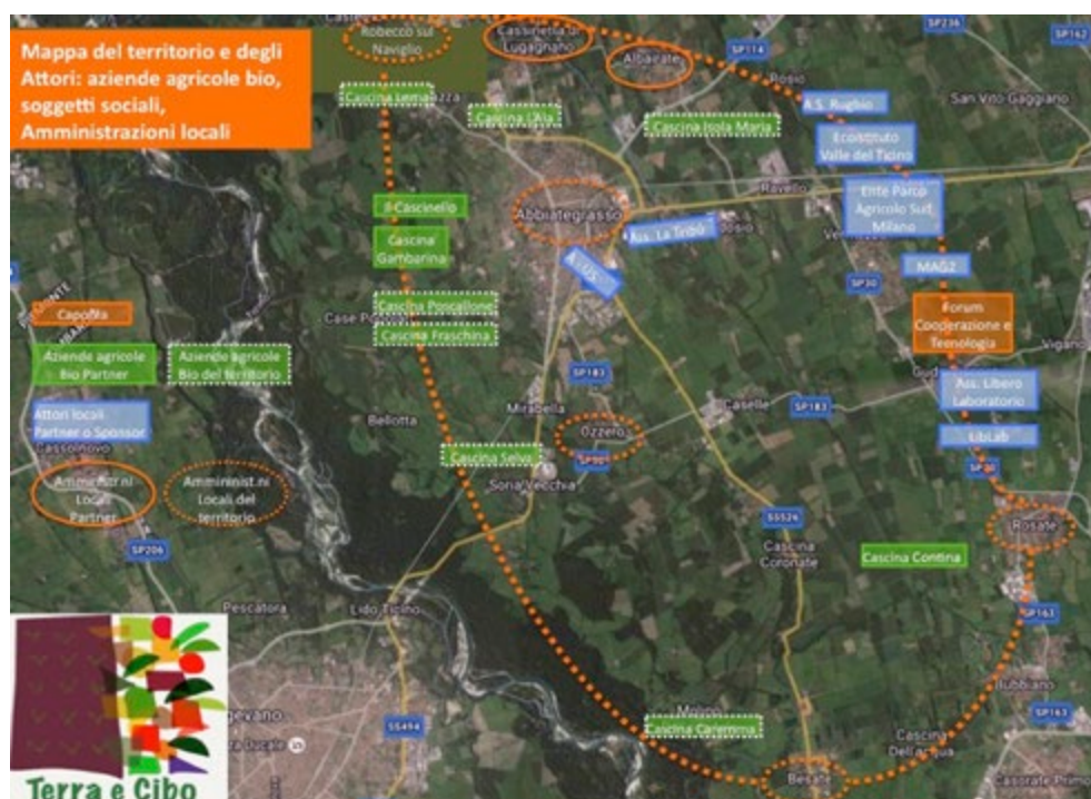
Figura 2. Mappa dell'area dell'Abbatense, a forma di palla da rugby, scelta come riferimento del progetto.

Congiungendo le cascine e i Comuni in cui sono insediate, si disegna un'area dell'Abbatense a forma di palla da rugby (fig. 2) in cui si è proposto di ricostruire, attorno alle 'isole' innovative citate, relazioni comunitarie tra i settori sociali coinvolgibili nel rapporto diretto con sistemi alternativi del cibo: si tratta di tutti gli attori, comprese le Pubbliche amministrazioni più sensibili, interessati alla possibilità di nutrire di nuovo le città di quest'area con i prodotti della propria campagna periurbana, come avveniva prima dell'industrializzazione dell'agricoltura, tenendo conto dei mutamenti ambientali in corso e dei fattori di rischio individuati.