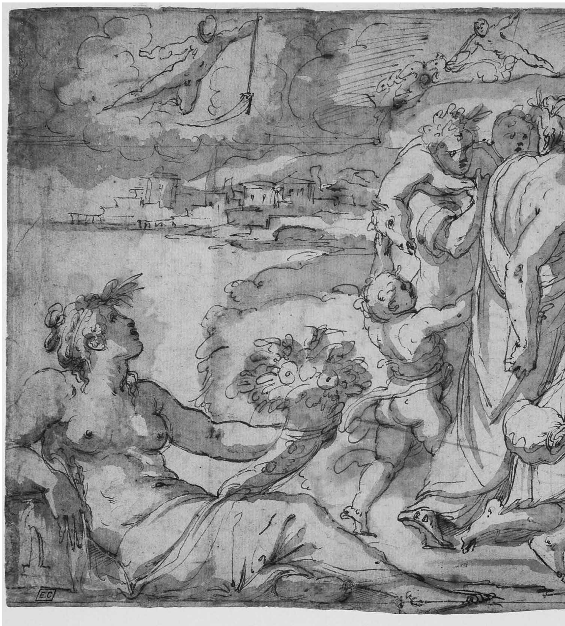
Fig. 9 G. Vasari, Studio per Le primizie della terra offerte a Saturno , 1555-1556ca. (New York, Metropolitan Museum of Art).