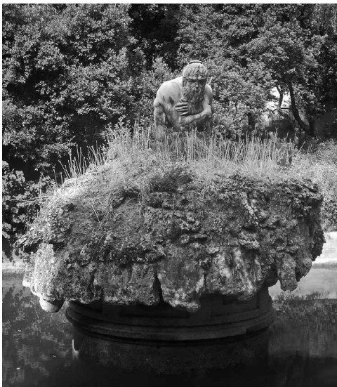
Fig. 8 B. Ammannati, Fontana dell'Appennino nella villa medicea di Castello a Firenze (foto Sailko 2006, CC BY-SA 3.0).