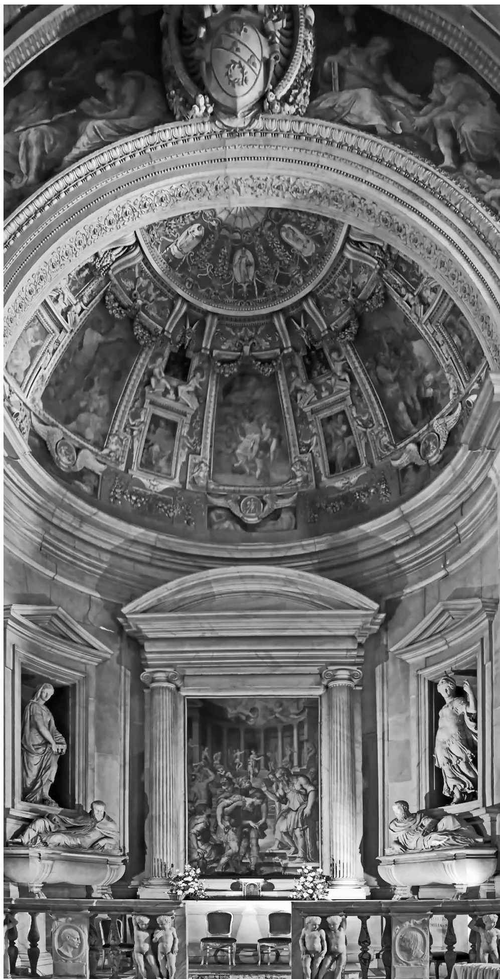
Fig. 4 Da G. Vasari, Studio per il ninfeo di villa Giulia (già Milano, collezione privata; da DAVIS, Per l'attività romana... cit. , fig. 16).