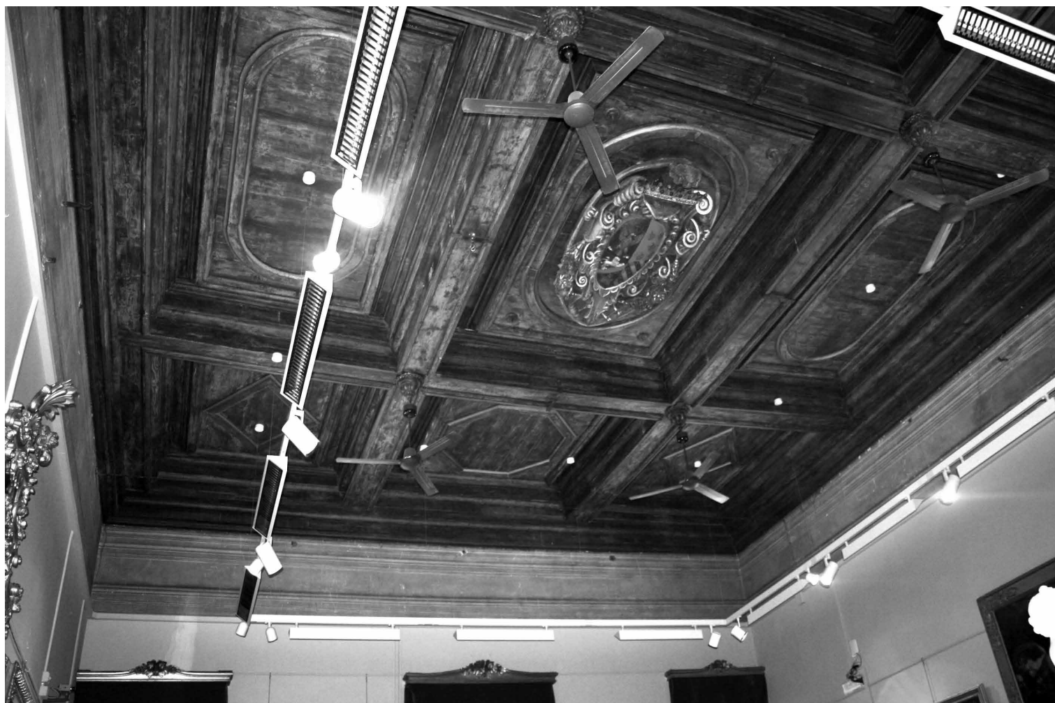
Fig. 4 Vista actual del techo lignario de la sala de planta noble del palacio Ramírez de Montalvo.