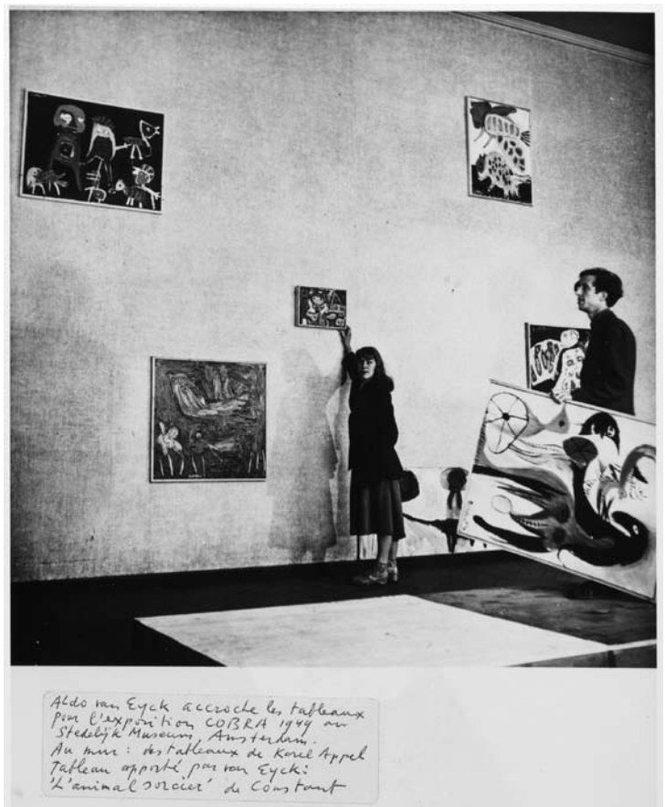
Aldo van Eyck accroche les tableaux pour l'exposition COBRA 1949 au Stedelijk Museum, Amsterdam. Au mur : des tableaux de Karel Appel. Tableau apporté par van Eyck: 'L'animal sorcier' de Constant