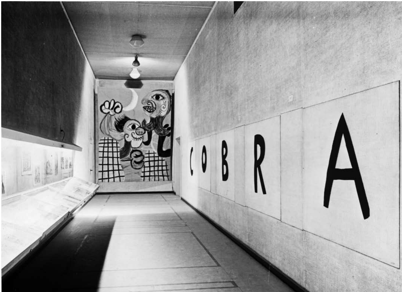
Constant's painting "Barricade" (1949) at the entrance of the Cobra exh. at the Stedelijk

Museum Amsterdam, installed by the architect Aldo van Eyck in 1949