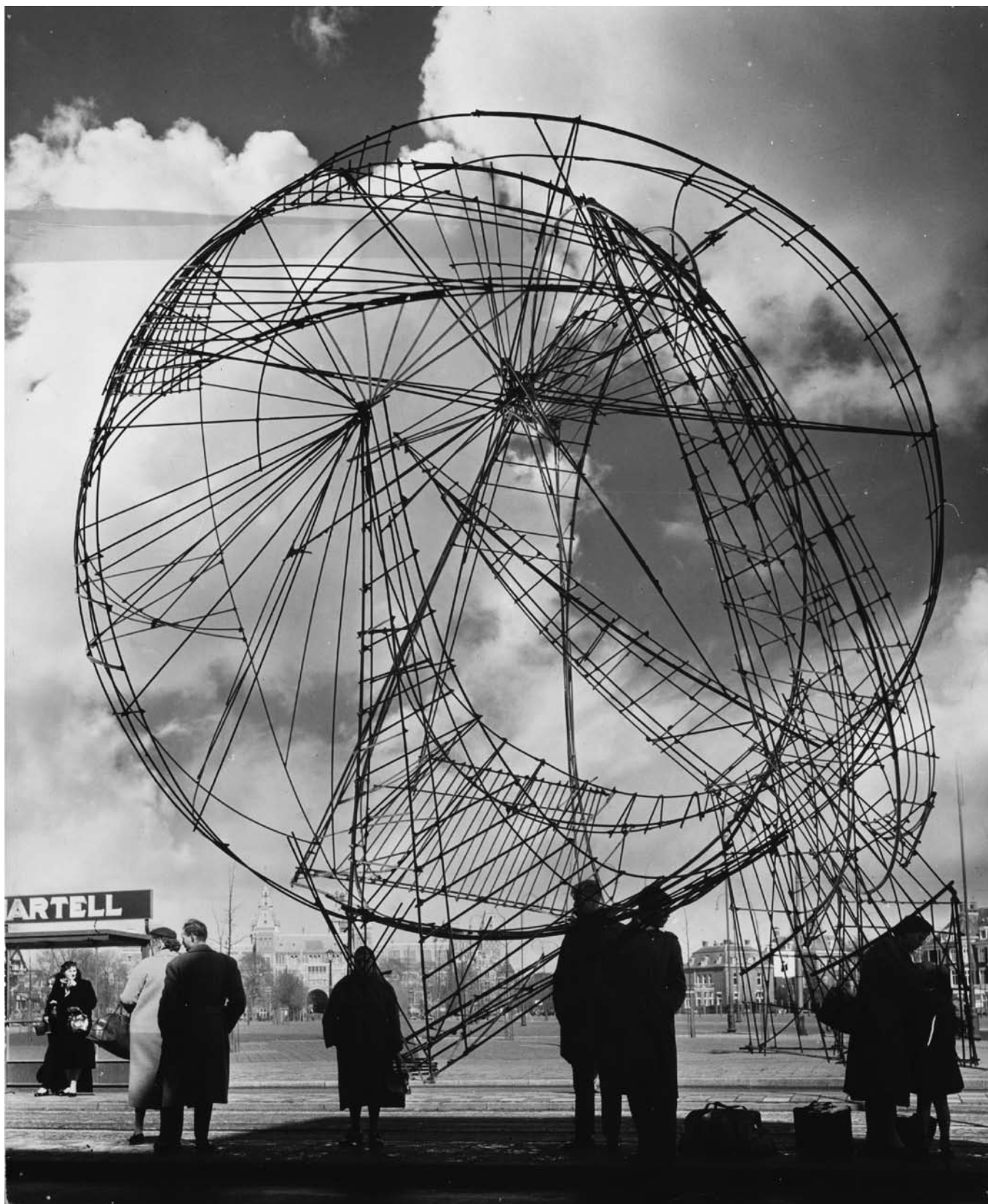
Jan Versnel, Photomontage of Constant's "Space Circus" in Museumplein, Amsterdam, c. 1956 (Gelatin silver print 36,5 x 30,4 cm) Photomontage Jan Versnel, Archive Fondation Constant © Constant/Fondation Constant c/o SIAE, Rome 2019 © Jan Versnel/MAI, Amsterdam