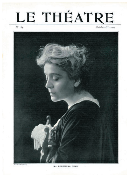
Fig. 5. Mario Nunes Vais, Ritratto di Eleonora Duse, fotografia («Le théâtre», ottobre 1905).