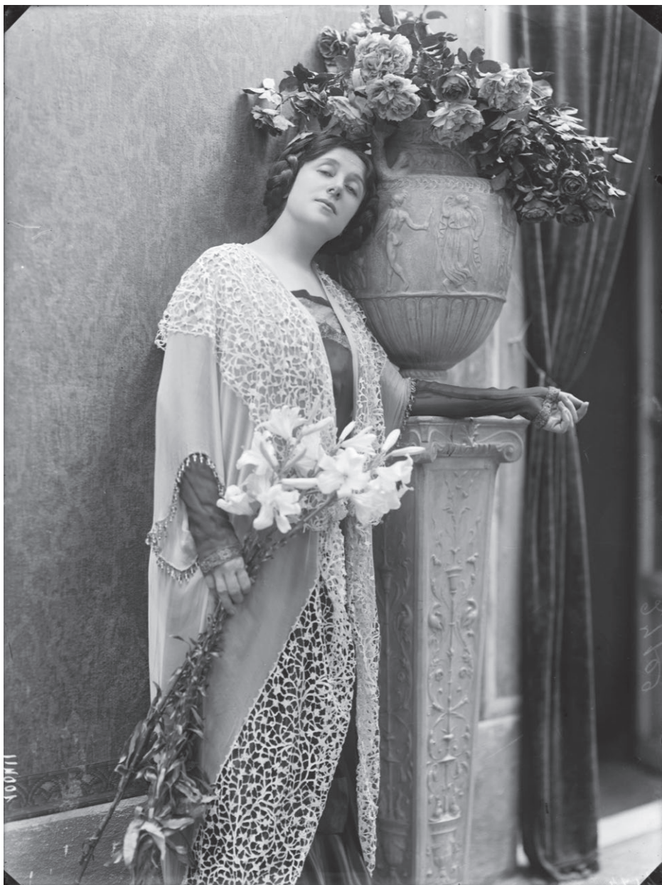
Fig. 9. Mario Nunes Vais, Ritratto di Tina Di Lorenzo, 1910 ca., fotografia (ICCD - Gabinetto fotografico nazionale, fondo Nunes Vais , inv. E100411).