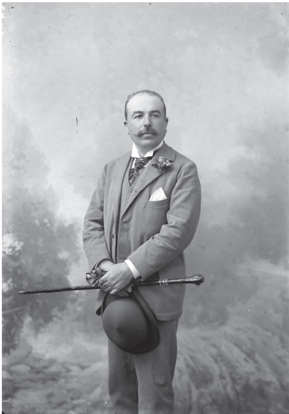
Fig. 10. Mario Nunes Vais, Autoritratto, 1910 ca., fotografia (ICCD - Gabinetto fotografico nazionale, fondo Nunes Vais , inv. F047739).