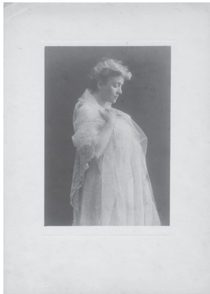
Fig. 8. Mario Nunes Vais, Ritratto di Eleonora Duse, fotografia (Fondazione Giorgio Cini, Istituto per il Teatro e il Melodramma, Archivio Eleonora Duse , inv. 1103).