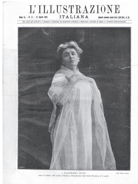
Fig. 7. Mario Nunes Vais, Ritratto di Eleonora Duse, fotografia («L'illustrazione italiana», LI, 1924, 17).