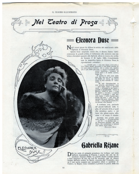
Fig. 6. Mario Nunes Vais, Ritratto di Eleonora Duse, fotografia («Il teatro illustrato», iv, 1908, 9).