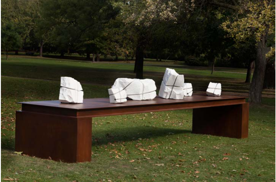
1 - Diario , 2016, h.150 x 600 x 120 cm, ferro, marmo statuario, cavi d'acciaio inossidabili Courtesy Mikayel Ohanjanyan e Galleria Tornabuoni Art Paris, foto Nicola Gnesi