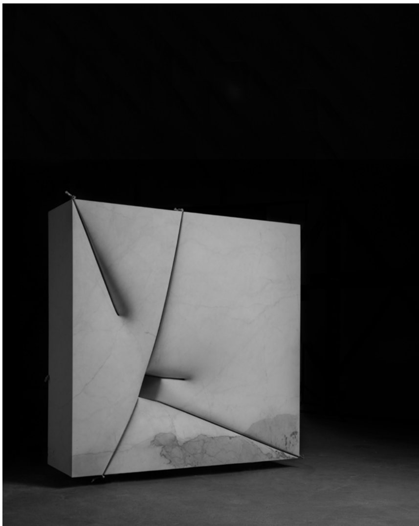
8 - Materialità dell'Invisibile , 2014, h. 160 x 160 x 50 cm, marmo statuario, cavi d'acciaio inossidabili, Courtesy Fondazione Henraux e Galleria Tornabuoni Arte, foto Nicola Gnesi