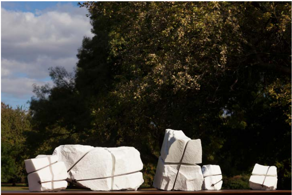
2 - Diario , 2016 (dettaglio), h.150 x 600 x 120 cm, ferro, marmo statuario, cavi d'acciaio inossidabili, Courtesy Mikayel Ohanjanyan e Galleria Tornabuoni Art Paris, foto Nicola Gnesi