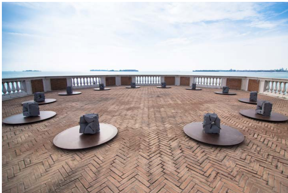
4 - Tasnerku (Dodici) , 2015, installazione \varnothing 12m, ogni singola opera h. 60 x \varnothing 120 cm, corten, basalto, cavi d'acciaio inossidabili. Courtesy Mikayel Ohanjanyan, foto Piero Demo