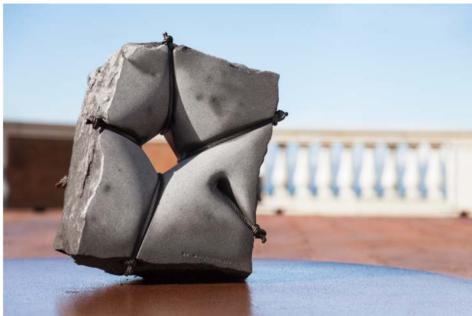
6 - Tasnerku (Dodici), 2015 (dettaglio), installazione \varnothing 12m, ogni singola opera h. 60 x \varnothing 120 cm, corten, basalto, cavi d'acciaio inossidabili. Courtesy Mikayel Ohanjanyan, foto Nicola Gnesi