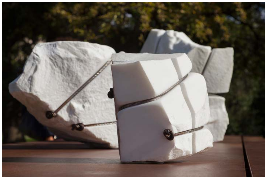
3 - Diario , 2016 (dettaglio), h.150 x 600 x 120 cm, ferro, marmo statuario, cavi d'acciaio inossidabili