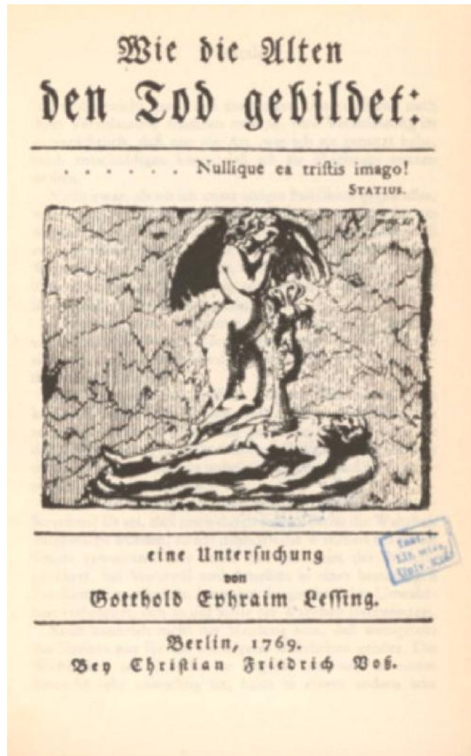
Fig. 9. Lessing, Wie die Alten den Tod gebildet , 1769, frontespizio (part. da un sarcofago con Prometeo, Roma, Campidoglio)