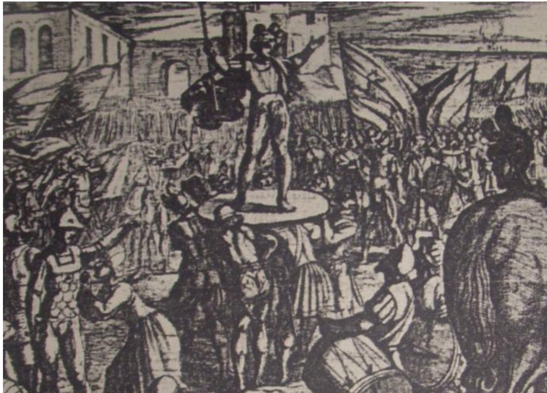
Fig. 4. A. Tempesta, Brinnone innalzato sugli scudi