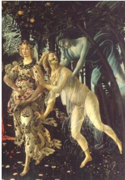
Fig. 2. Zefiro insegue Chloris (part. da Botticelli, La Primavera )