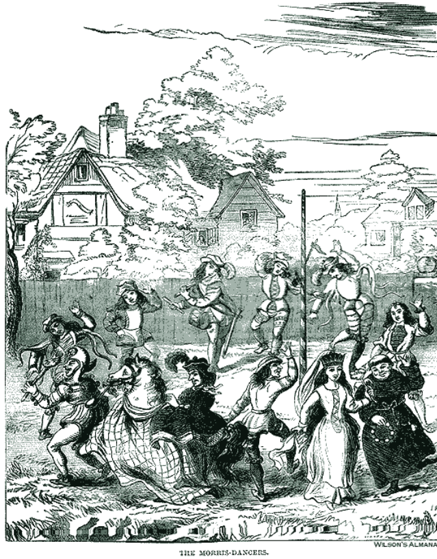
Fig. 5. Morris dance a Pentecoste (da R. Chambers, The book of days , 1881)