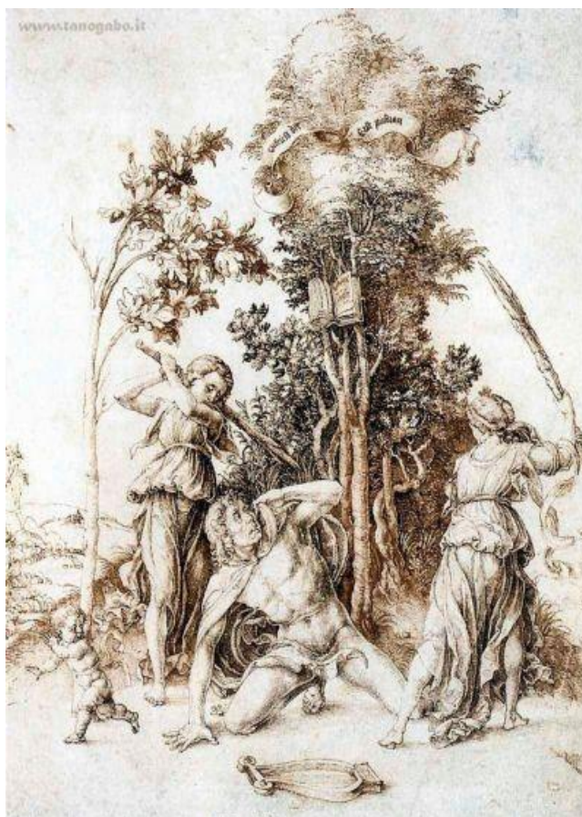
Fig. 1. La morte di Orfeo nell'immagine di Dürer, studiata da Warburg ( Dürer und die italienische Antike , 1905)