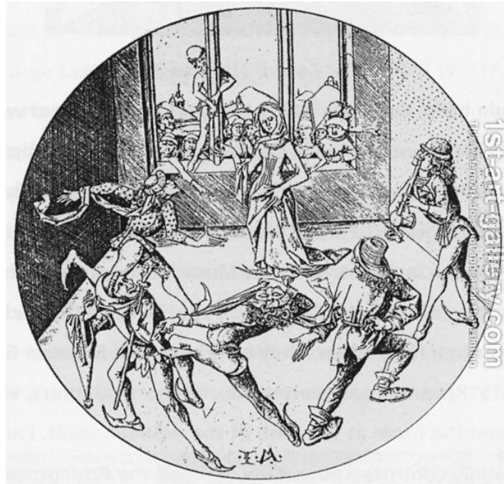
Fig. 6. Morris dance, 1475 (Israhel van Meckenem il giovane)